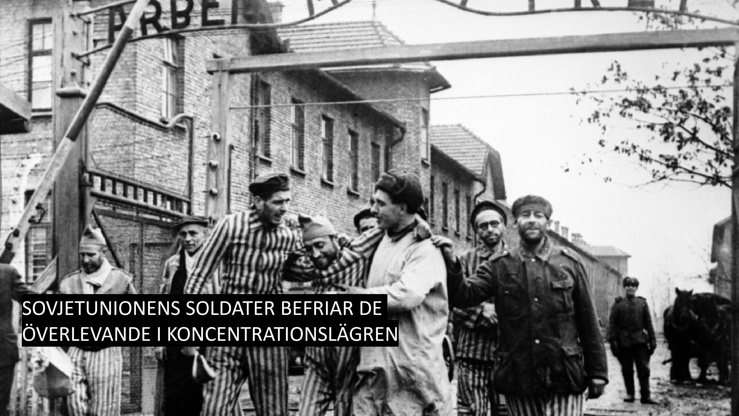
SOVJETUNIONENS SOLDATER BEFRIAR DE ÖVERLEVANDE I KONCENTRATIONSÄGREN