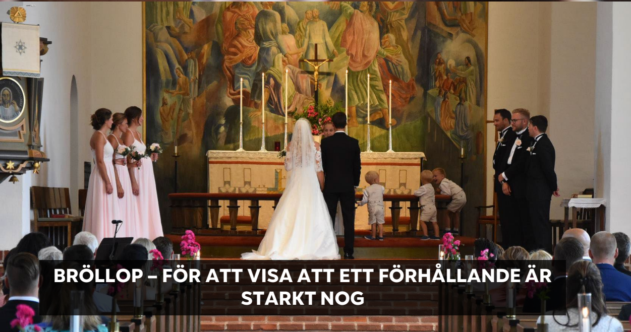
BRÖLLOP – FÖR ATT VISA ATT ETT FÖRHÅLLANDE ÄR STARKT NOG