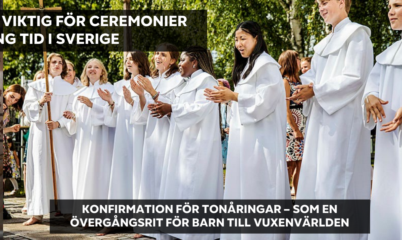
KONFIRMATION FÖR TONÅRINGAR – SOM EN ÖVERGÅNGSRIT FÖR BARN TILL VUXENVÄRLDEN