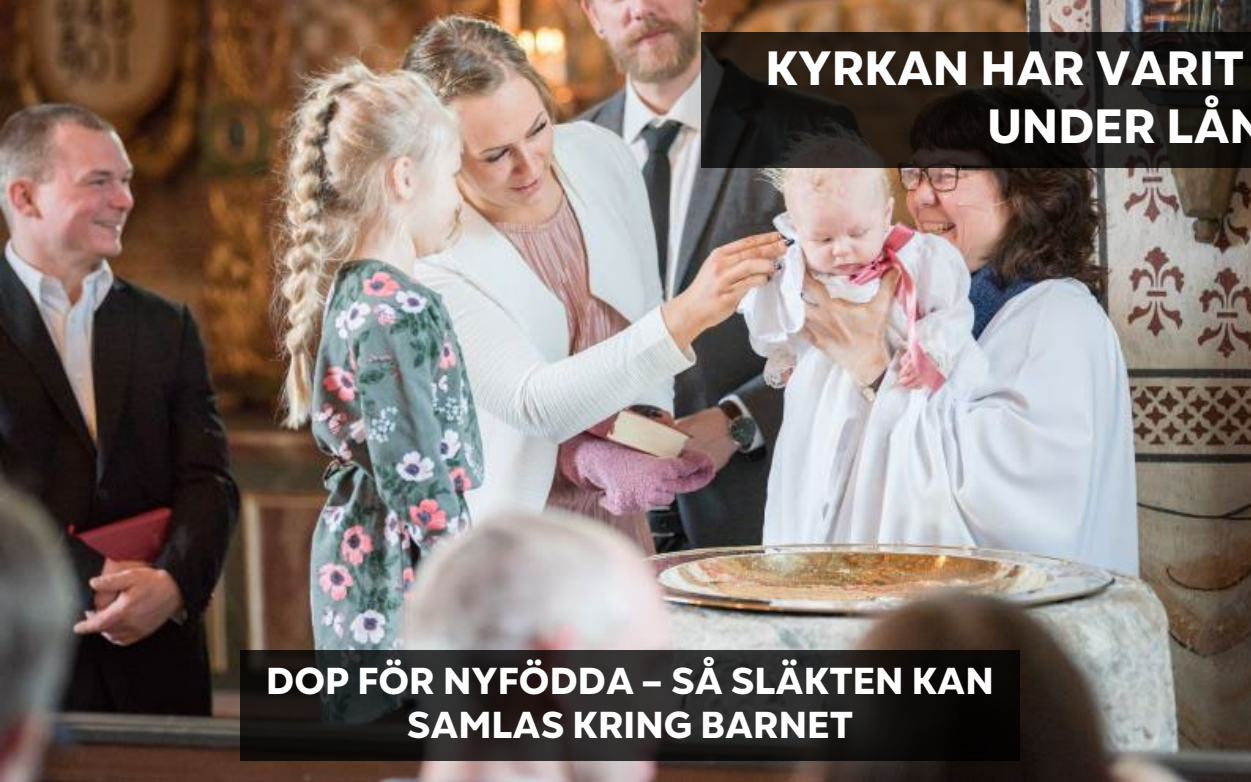
DOP FÖR NYFÖDDA – SÅ SLÄKTEN KAN SAMLAS KRING BARNET