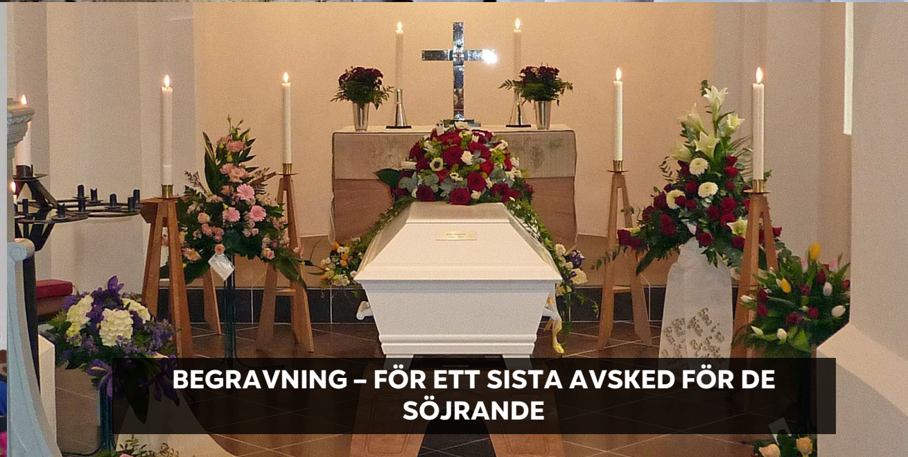
BEGRAVNING – FÖR ETT SISTA AVSKED FÖR DE SÖJRANDE