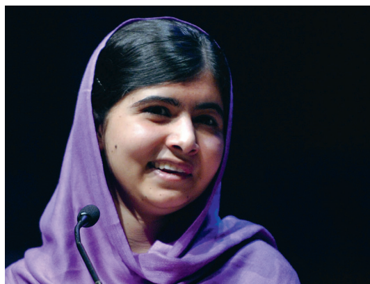
Bilden visar Malala Yousafzai, mottagare av Nobels fredspris 2014. Hon kämpar för flickors rätt till utbildning.

Försök att förtydliga ditt svar med exempel och fakta.