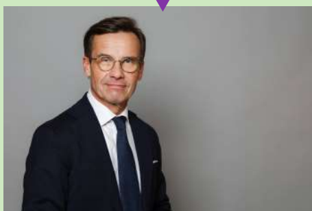
Statminister Ulf Kristersson