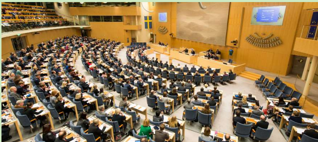
Riksdagens plenissal under en votering