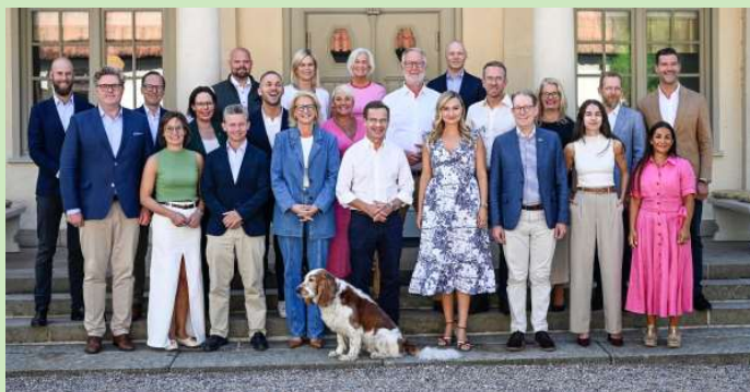
Sveriges regering bestående av statsråd från tre partier